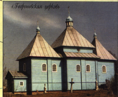
1. Юрьевская церковь